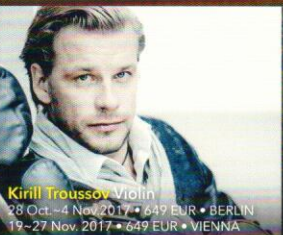
Kirill Troussov Violin 28 Oct.–4 Nov. 2017 • 649 EUR • BERLIN 19–27 Nov. 2017 • 649 EUR • VIENNA