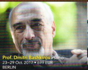
Prof. Dmitri Bashkirov Piano 23–29 Oct. 2017 • 699 EUR BERLIN