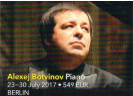
Alexej Botvinov Piano 23–30 July 2017 • 549 EUR BERLIN