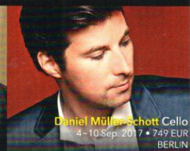
Daniel Müller-Schott Cello 4–10 Sep. 2017 • 749 EUR BERLIN